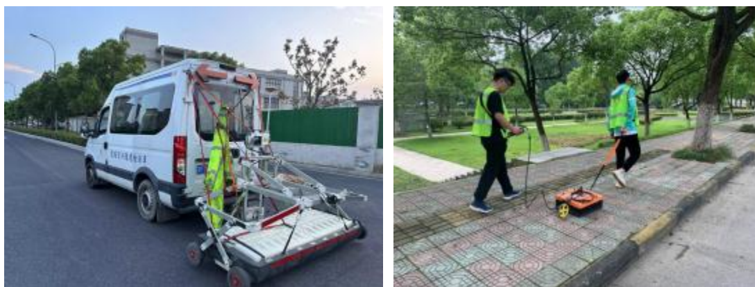
图 3地质雷达检测示例